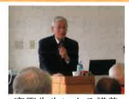
富田先生による講義