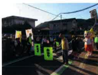
活動の様子（井原市立西江原小学校）