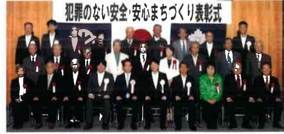
犯罪のない安全・安心まちづくり表彰式