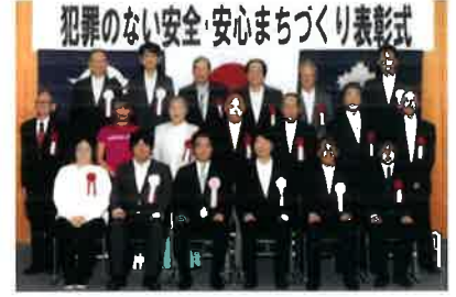
犯罪のない安全・安心まちづくり表彰式