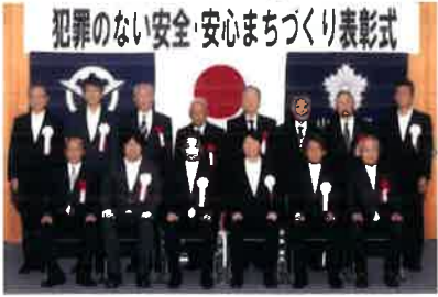
犯罪のない安全・安心まちづくり表彰式

10月7日（月）、県庁3階大会議室で、「犯罪のない安全・安心まちづくり表彰式」を開催しました。式典では、安全・安心まちづくりの推進や特殊詐欺被害防止に特に貢献があった個人や団体等の代表の皆さんへ、伊原木知事から表彰状が贈られました。